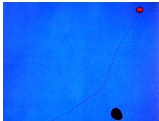
Blue III, Joan Mirò 1961

Carissimi Capi Branco e Carissimi Capi Cerchio,